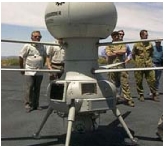
Рисунок 2. БЛА CL-327