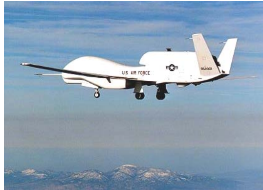
Рисунок 4. БЛА Global Hawk

известен под индексом Tier-3 и представлялся как продолжение линии малозаметного бомбардировщика B-2, однако программа Tier-3 оказалась слишком амбициозной и не была реализована. Вместо "Tier-3" ВВС США решили разрабатывать меньший - Tier-3 - : БЛА Darkstar и Tier-2+: Super Predator или Global Hawk (Рис. 4).