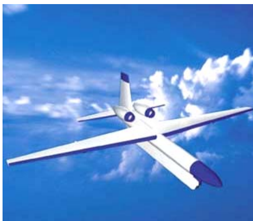
Рисунок 7. Шведский БЛА концепции HALE

БЛА имеет два турбовентиляторных двигателя, весит около 8 тонн с размахом крыла 30 м (Рис.7).