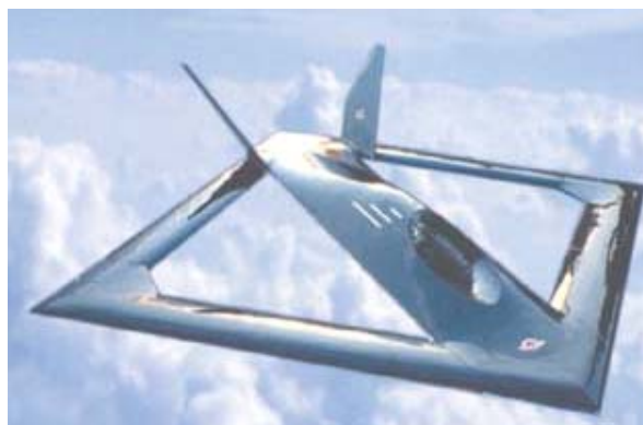
Рисунок 5. БЛА Sensor Craft

В США продолжаются концептуальные исследования в области БЛА концепции HALE, в том числе исследуются нетрадиционные компоновки аппарата. Так, NASA работает по этому направлению начиная с 1980 г. в рамках программы ERAST. Под руководством исследовательской лаборатории ВВС США исследуется проект под названием Sensor Craft (Рис.5), в работе также принимают участие Boeing Phantom Works, NASA and Air Force Laboratory's sensor and materials directorate. В качестве целевого назначения аппарата рассматриваются варианты использования, в том числе в качестве AWACS или Joint STARS [3].