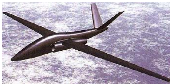
Рисунок 8. Французский БЛА концепции HALE ("Фрегат" фирмы Matra- Aerospaciale)

Разработка этого БЛА потребует больших инвестиций. В финансовом плане Aerospaciale высказывает мнение, что разработка такой системы будет возможной на двусторонней либо на многосторонней основе при заинтересованности в ней сразу нескольких европейских стран. В этом случае первый прототип перспективного БЛА мог бы подняться в воздух через пять лет после начала запуска программы.