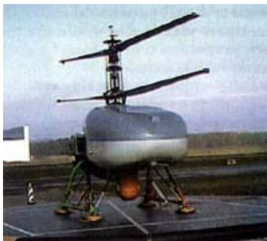
Рисунок 3. БЛА Seamos

Бюджетные ограничения повышают значимость этапа концептуальных исследований с тем, чтобы не ошибиться в выборе проектных решений в отношении будущих БЛА.