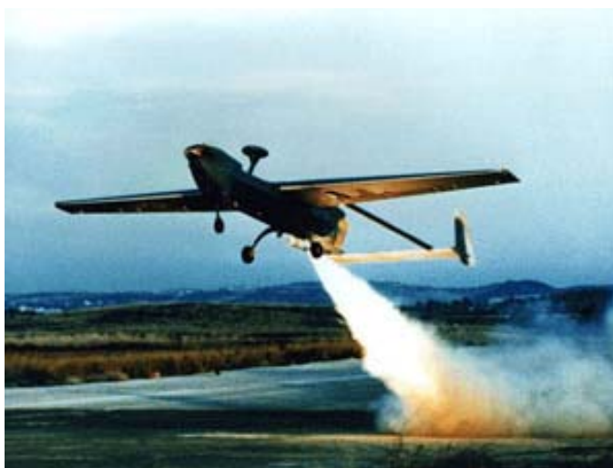
Рисунок 1. БЛА Hunter

В современных условиях возможности использования подобных БЛА расширяются, в том числе в части ведения радиотехнической разведки и определения местоположения излучающих целей, а также лазерной подсветки целей. Последняя задача стала реальностью в ходе конфликта в Югославии, когда США оснастили три БЛА Predator системами лазерного целеуказания. Армия США рассматривает возможность использования в этом же качестве тактических БЛА Hunter (Рис. 1).