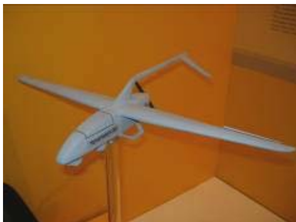
Рисунок 15 а. Hermes 90 (макет на выставке)

Обращает внимание, что под маркой Hermes 90 показан БЛА MiniFalcon II, производимый компанией Innoson.