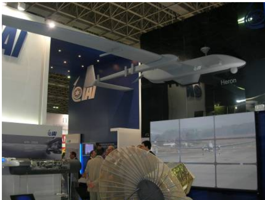
Рисунок 13. Макет БЛА Heron являлся центральным элементом экспозиции IAI