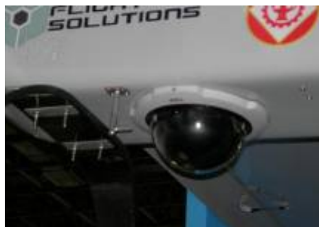
Рисунок 12 б.