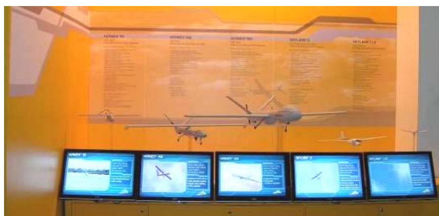
Рисунок 14. На стенде Elbit макетами представлена вся линия БЛА, включая Hermes 900

Обращает внимание, что под маркой Hermes 90 показан БЛА MiniFalcon II, производимый компанией Innoson.