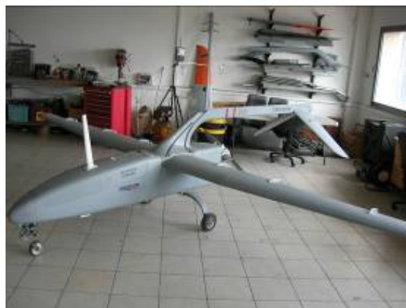
Рисунок 15 б. Mini Falcon II (образец в цехе)