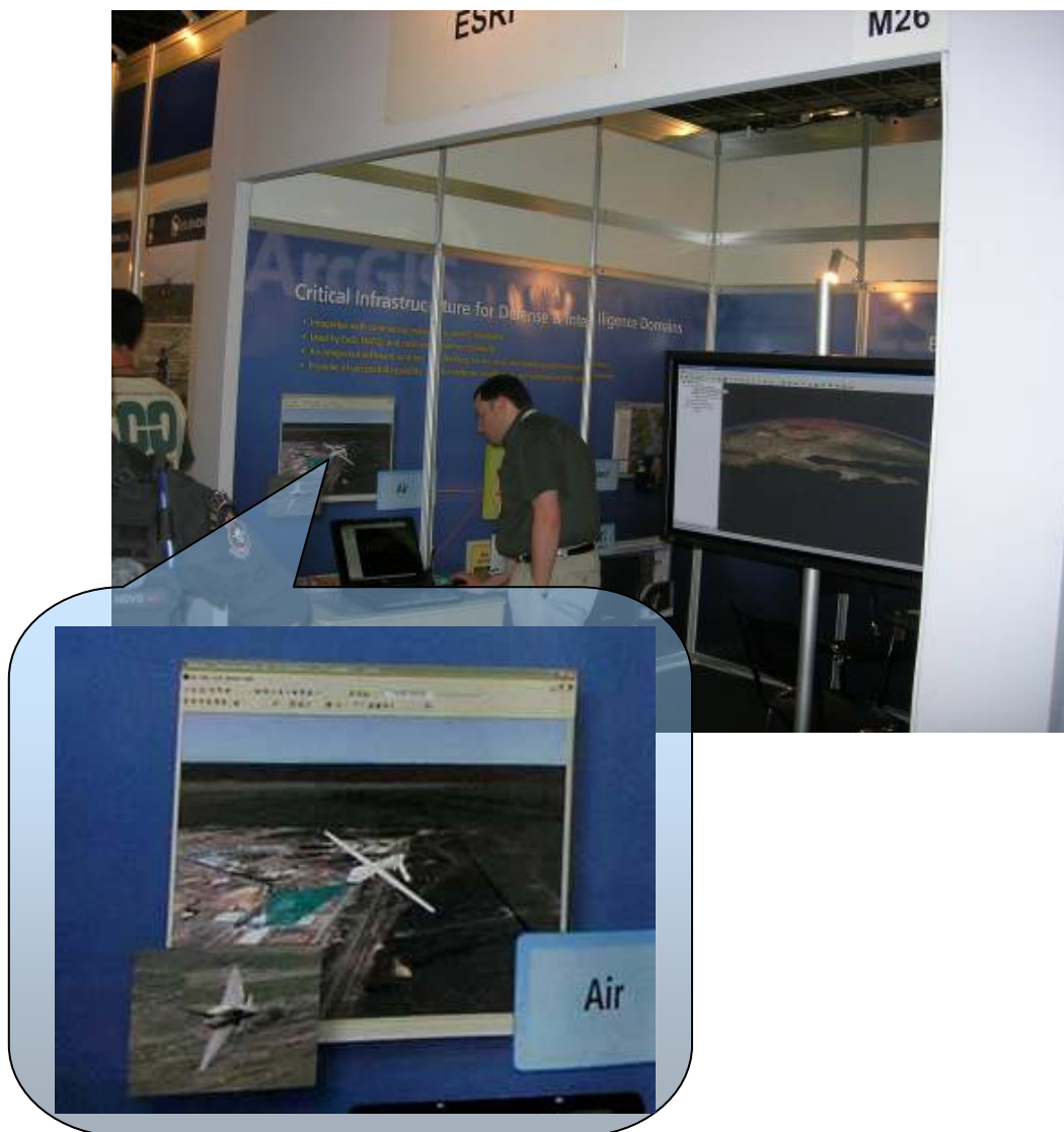
Рисунок 17. ГИС-система компании ESRI