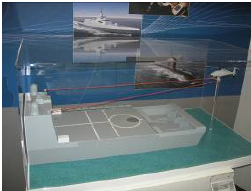
Рисунок 16. Посадка вертолета Schiebel Camcopter на палубу движущегося судна

На стенде австрийской компании Schiebel был продемонстрирован макет, иллюстрирующий посадку беспилотного вертолета Camcopter на палубу корабля с применением системы лазерного наведения. Кроме этого демонстрировалось видео.