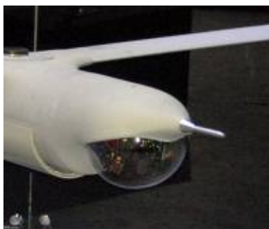
Рисунок 12 а.

Обращает внимание, что практически все БЛА местных разработчиков экспонировались, оснащенные системами наблюдения, заимствованными, вероятно, в охранных системах (Рисунок 12 а, б, в)