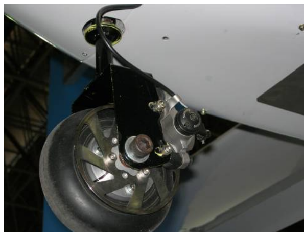
Рисунок 11. Дисковый тормоз на колесе шасси БЛА

FS-02- типичный носимый аппарат «забугорного» обзора взлетной массой 3 кг.