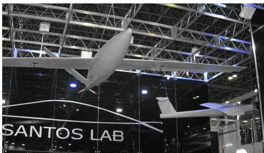
Рисунок 7. БЛА на стенде компании SANTOS LAB

Представлена линия БЛА массой от 1,8 до 20. Все выставленные образцы выглядят как модели и имеют достаточно странные аэродинамические очертания.