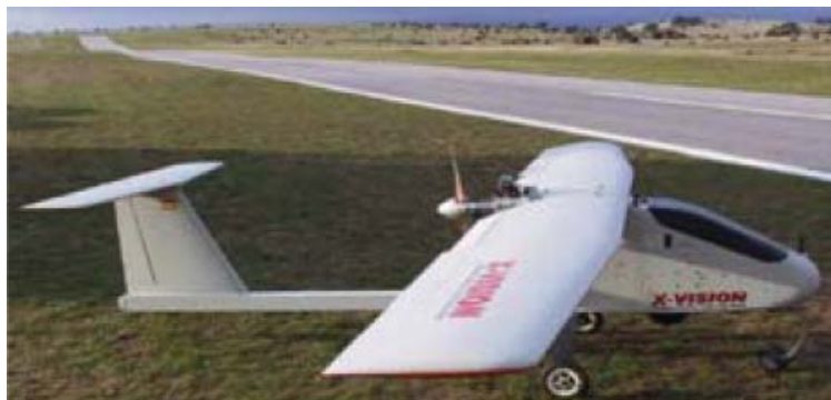
Рисунок 8. БЛА X-VISION

качестве полезной нагрузки БЛА может быть оснащен ТВ- и ИК-камерами, фотоаппаратом высокого разрешения и т.п. На БЛА установлен двухцилиндровый двухтактный двигатель. Взлет и посадка БЛА осуществляются «по-самолетному» на полосы длиной 200 м., для чего аппарат имеет неубираемое трехстоечное шасси.