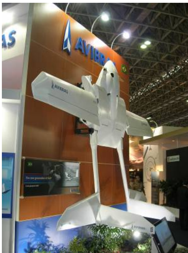
Рисунок 1. БЛА компании Avibras

Основным экспонатом стенда был экспериментальный беспилотный конвертоплан: БЛА с изменяемым направлением вектора тяги двигателя.