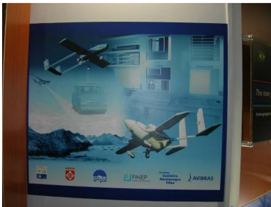
Рисунок 2. Выставочный плакат компании Avibras

Единственным органом управления БЛА являются элероны. Более того, как видно из рисунка, где аппарат показан во взлетной конфигурации, набегающий поток от винта неминуемо создает усилие, действующее на плоскости как прижимающее усилие. Поэтому энергетическая эффективность аппарата, по-видимому, не высока.