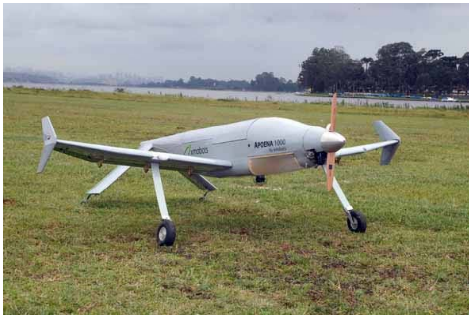
Рисунок 3. БЛА Ароена

Из конструктивных решений следует отметить следующие особенности.