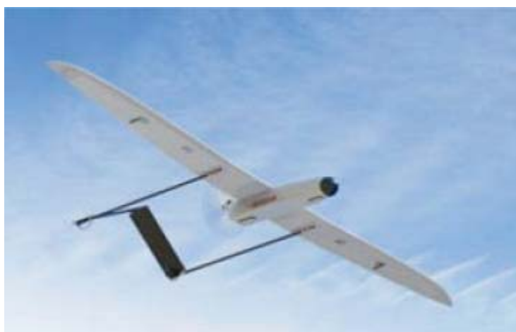
Рисунок 9. Мини-БЛА SCAN

Второй – 5-килограммовый мини-БЛА SCAN. Он позиционируется компанией, как сверхлегкий переносной мини-БЛА. На борту может быть установлена различная оптикоэлектронная и ИК-аппаратура наблюдения для эксплуатации комплекса как днем, так и ночью. Аппарат оснащен 600-Вт электродвигателем. Взлет БЛА производится броском руки, посадка – «на брюхо» или при помощи парашюта (дополнительная опция). Основные технические характеристики этих двух БЛА представлены в Таблице 2.