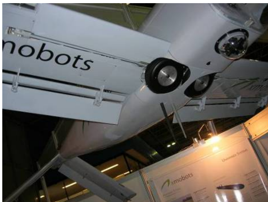
Рисунок 4. Шасси БЛА Ароена в сложенном положении

Во-первых, это длинные стойки убирающихся шасси, по словам разработчиков, позволяют работать с высокой травой (хотя, хорошо известно альтернативное решение – просто подстричь газон).